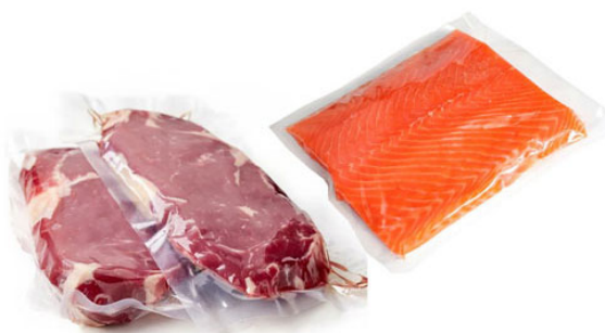
Свежее мясо и морепродукты

Данное оборудование хорошо подходит для малого и среднего бизнеса в различных областях производства.